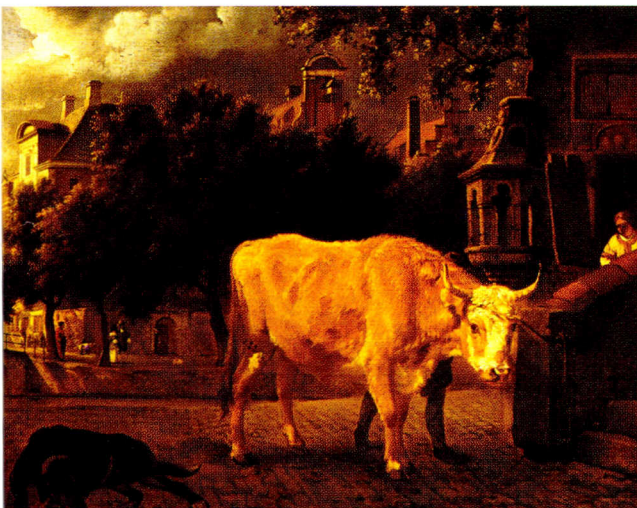
Institute of Arts, Detroit