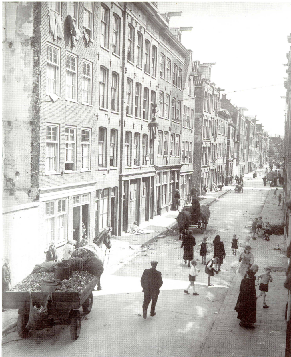
De Jordaan in 1946. Het zou niet voor lang zijn, maar in het naoorlogse Amsterdam had het paard de auto verdrongen.

in hokken houden, en in 1413 werd het verboden varkens over straat te laten lopen. Ook deze keur moest verschillende malen worden herhaald. Zo bepaalde een keur uit 1490, dat "alle diegheene, die vercken by der straet ofte by die muer houden lopen, dat sy hoir vercken tuschen dit ende morgenavont van der straet ende muer thys halen sullen; indien men enige vercken vijnden, die sullen die gasthuysmeesteren deser stede tot hemluden nemen." Vier varkens waren van dit straatverbod vrijgesteld: twee van het Sint Antoniesgasthuis – het leprozenhospitaal buiten de stadspoort, ter hoogte van het huidige Waterlooplein – en de twee van het Sint Cornelisgasthuis. Deze vier varkens, voorzien van een bel en herkenbaar aan een afgesneden oor, kregen het monopolie om straatafval om te zetten in spek.