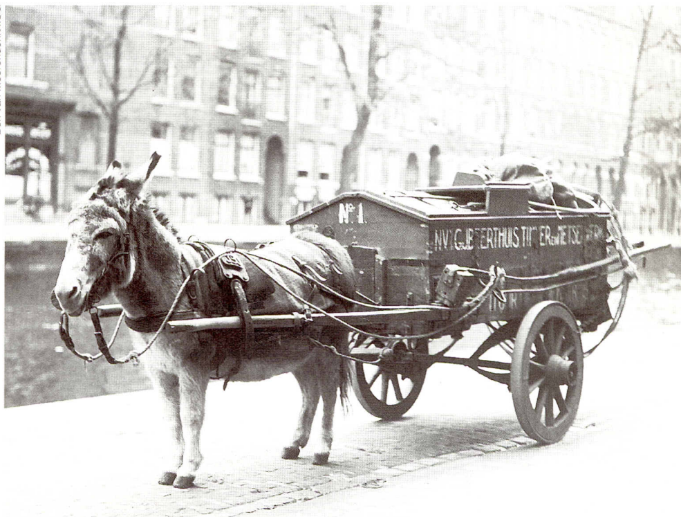
Ben van Meerendonk/ISG

Ezel voor een wagen van de putjesschepper, ± 1938. Hier dient het beest als trekdiër, maar rond de eeuwwisseling liepen er kuddes ezeltinnen langs de grachten, op weg naar zwangere dames: ezeltinnenmelk zou je van het zijn.