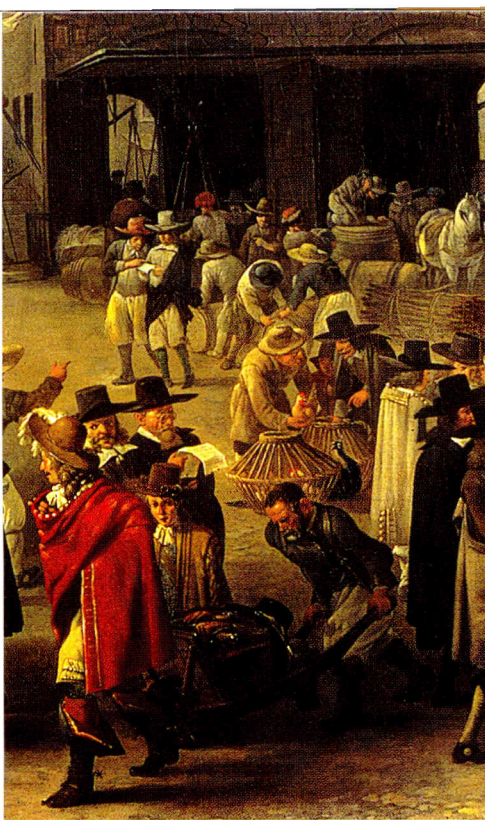
Amsterdams Historisch Museum

Detail van de pluimveeverkoper op het schilderij 'Stadhuis in aanbouw met Nieuwe kerk' uit 1656 van Johannes Lingelbach (1622-1674). Bijna 300 jaar later is het model van de kippenmand nagevoeg hetzelfde, zoals te zien is op de foto van de Amstelveld-markt op bladzijde 190.