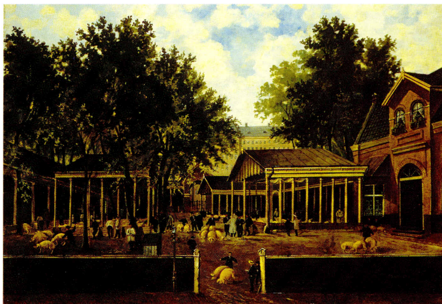
Amsterdams Historisch Museum

'Varkensmarkt bij de Lepelstraat' geschilderd door A. Heide in 1884. De markt was er in 1867 ingericht, op een voormalige gemeentelijke asbelt. Op de achtergrond het Nieuwe Werkhuis, nu het verpleeghuis in de Roetersstraat.