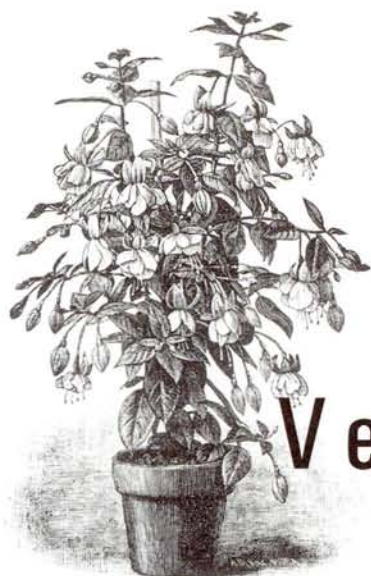
FUCHSIA met gevulde bloemen.